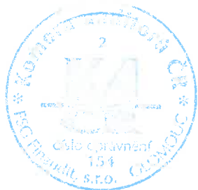
FSG Finaudit, s.r.o. třída Svobody 645/2, Olomouc, auditorské oprávnění společnosti KAČR č. 154 Ing. Jakub Šteinfeld auditor odpovědný za vypracování zprávy jménem společnosti, auditorské oprávnění KAČR č. 2014